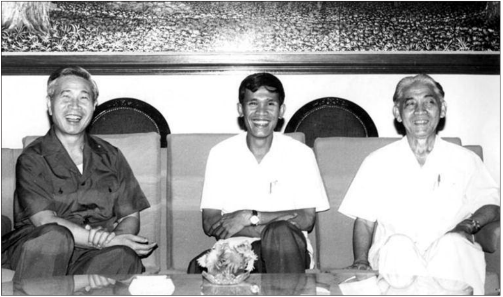
Bộ trưởng Bộ Ngoại giao Nguyễn Cơ Thạch dự Hội nghị Bộ trưởng Ngoại giao ba nước Đông Dương lần thứ 11 tại Phnôm Pênh (8-1985)