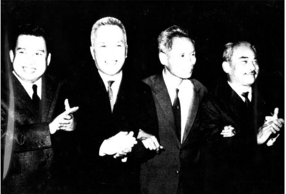
Gặp gỡ tại Hội nghị cấp cao nhân dân ba nước Đông Dương. Từ trái sang: Quốc trưởng Campuchia N. Xihanúc, Chủ tịch Đoàn Chủ tịch Ủy ban trung ương Mặt trận dân tộc giải phóng miền Nam Việt Nam, luật sư Nguyễn Hữu Thọ, Thủ tướng nước Việt Nam Dân chủ Cộng hòa Phạm Văn Đồng, Chủ tịch Mặt trận Lào yêu nước, Hoàng thân Xuphanuvông (1970)