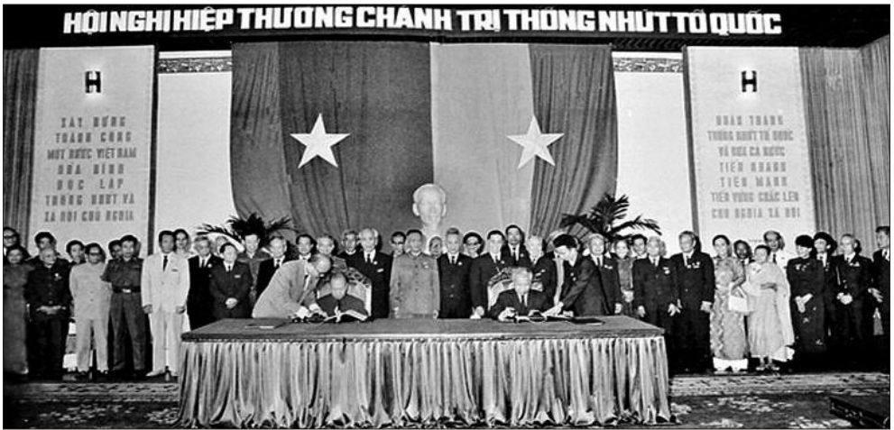
Chủ tịch Trường Chinh - Trưởng Đoàn đại biểu miền Bắc và ông Phạm Hùng - Trưởng Đoàn đại biểu miền Nam sau lễ ký các văn kiện chính thức của Hội nghị hiệp thương chính trị thống nhất đất nước về mặt nhà nước (21-11-1975)