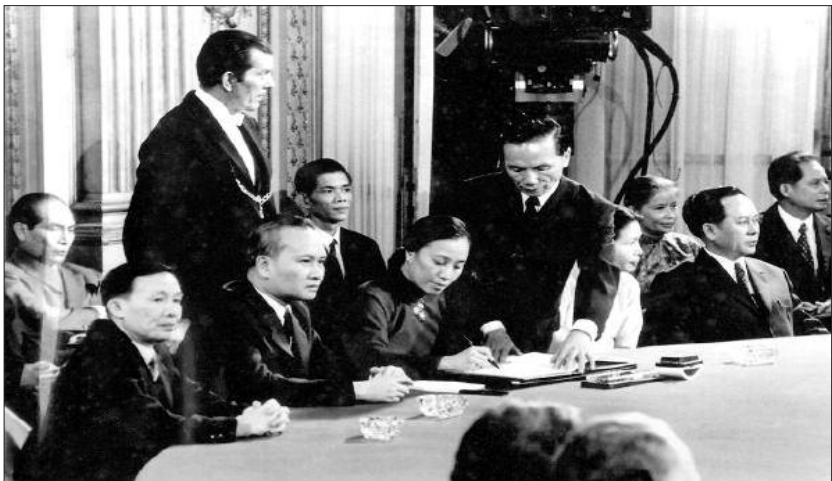
Toàn cảnh Hội nghị Pari về Việt Nam (1-1973)