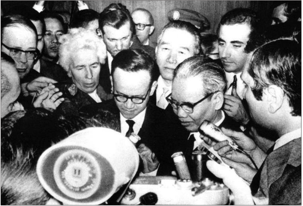
Bộ trưởng, Trưởng Đoàn đàm phán Chính phủ Việt Nam Dân chủ Cộng hoà Xuân Thủy tại Hội nghị Pari về Việt Nam ở sân bay Boócgiê, Pari (8-5-1968)