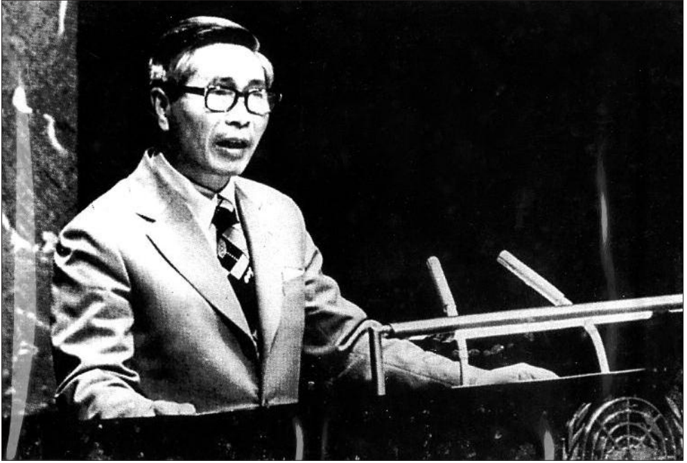
Bộ trưởng Bộ Ngoại giao Nguyễn Cơ Thạch đọc diễn văn tại Khóa họp thứ 39 Đại hội đồng Liên hợp quốc (9-10-1984)