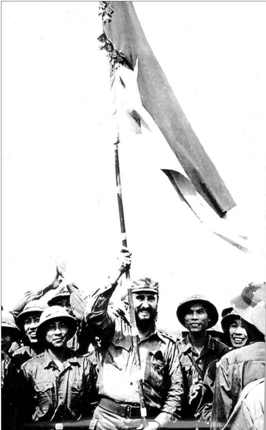
Chủ tịch Cuba Phiden Caxtorô giương cao lá cờ truyền thống bách chiến bách thắng của đoàn Khe Sanh Quân giải phóng Trị - Thiên - Huế anh hùng trong chuyến thăm của một nguyên thủ nước ngoài đầu tiên tới vùng giải phóng Quảng Trị (9-1973)