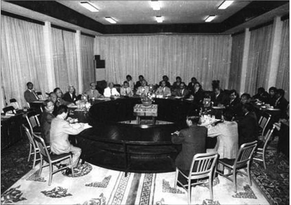
Đoàn đại biểu Đảng, Chính phủ Việt Nam do Tổng Bí thư Lê Duẩn dẫn đầu dự cuộc gặp mặt cấp cao Việt Nam - Lào - Campuchia (12-1985)