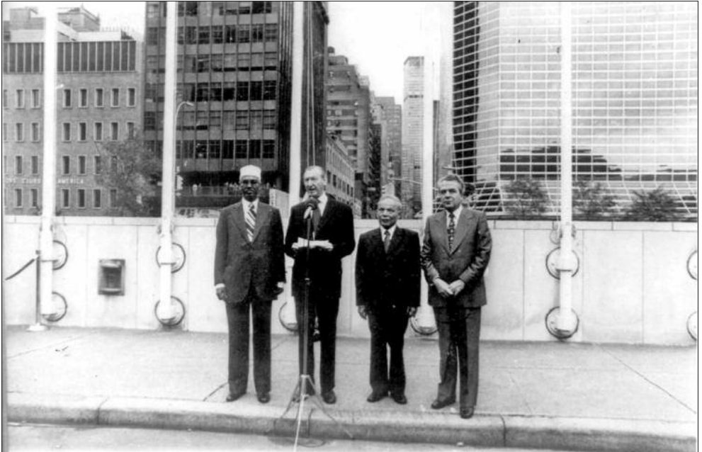
Ngày 20-9-1977, Việt Nam trở thành thành viên chính thức của Liên hợp quốc. Trong ảnh: Phó Thủ tướng, Bộ trưởng Bộ Ngoại giao Nguyễn Duy Trinh dự Lễ kéo cờ Việt Nam tại trụ sở Liên hợp quốc